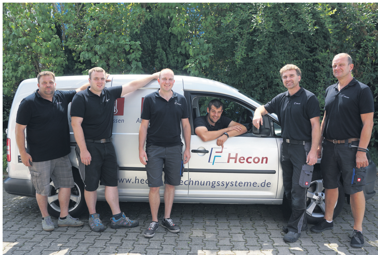
Das Servicetechniker-Team von Hecon