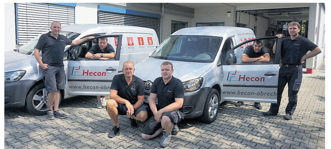
Die Hecon Abrechnungssysteme GmbH verfügt momentan über sechs eigene Servicetechniker.

Die langfristige Unternehmensentwicklung ist für Hecon einer der bedeutendsten Erfolgsfaktoren. So steht bei Hecon die generationenübergreifende Sicherung des eigenen Unternehmens anstatt kurzfristiger Gewinnoptimierung im Mittelpunkt. Als Familienunternehmen verfolgt Hecon auch andere Werte als Großkonzerne. Jeder einzelne Mitarbeiter wird bei Hecon geschätzt, es wird eine Unternehmenskultur gemeinsam mit den Mitarbeitern gelebt. Gewachsene Kunden- und Lieferantenbeziehungen sowie langfristige Bindung der Mitarbeiter sind den Friedrichs wichtig. Sie legen Wert auf eine familiäre Atmosphäre in ihrem Unternehmen. Die Verwurzelung in der Region ist ebenso eine typische Eigenschaft eines Familienunternehmens. Sei es bei der Unterstützung von Vereinen oder sonstigen Institutionen, im Ehrenamt im Verein oder in anderen Gremien. Außerdem unterstützt die Hecon Abrechnungssysteme GmbH regelmäßig Menschen, denen es leider nicht so gut geht. Dies gehört für die Geschäftsführer zum Selbstverständnis ihrer unternehmerischen Verantwortung. In diesem Jahr wurde die DKMS mit einer großzügigen Spende bedacht.